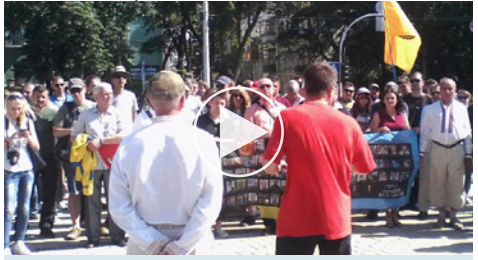
Мітинг «За перемогу!» 28 червня 2017 року

Також було взято участь у мітингу щодо відзначення Дня Конституції України. Але головним інструментом пропаганди і в подальшому планується все-таки робота в соціальних мережах.