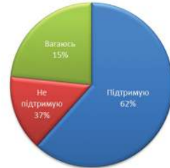
Чи підтримуєте ви обрання районних голів міліції громадянами?

Усього відповіли на запитання 214 осіб. Відмовились відповідати 214 осіб.